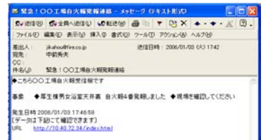
パソコンへのメール通報

環境問題への対応としては、エコマーク認定消火器での設置・既存消火器の更新のご提案。（通常弊社販売商品はエコマーク認定商品です）また、エコ消火器及びその点検をリースにして、お客様の消火器の廃棄物をゼロに、CO 2 排出量もゼロにする『ECOSS ゼロエミサービス』のご提案を始めます。