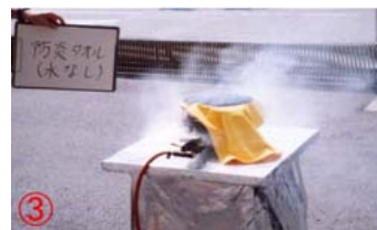
泉佐野市消防本部での防災加工タオル燃焼実験