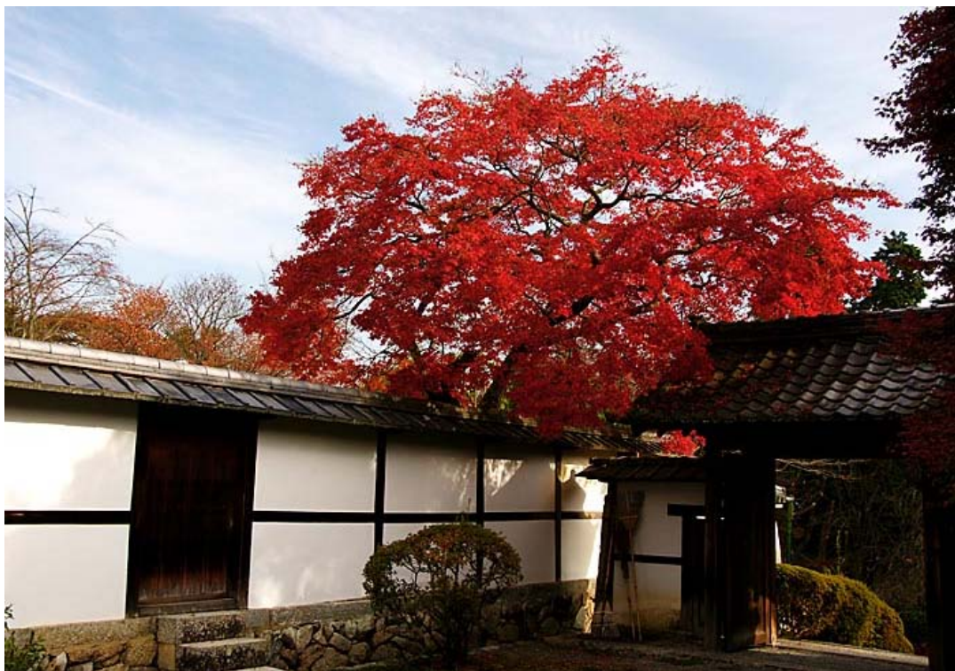
「古寺秋色」(大津の三井寺)