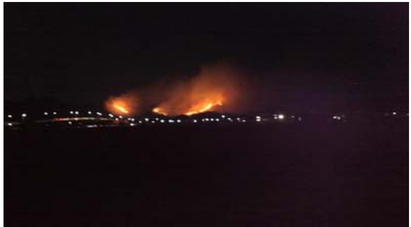
2011年1月高砂市で発生した山火事

林野火災の件数は、2,093件で、前年同期より701件増加(+50.4%)し、延べ焼損面積は約2,071haで、前年同期より約1,315ha増加(+174.1%)しています。例年、空気が乾燥する春先に林野火災が多発しており、林野庁と共同で火災予防意識の啓発を図り、予防対策強化等のため、春季全国火災予防運動期間中の3月1日から7日までを全国山火事予防運動の実施期間とし、平成24年は「忘れない 山への感謝と 火の始末」という統一標語のもと、様々な広報活動を通じて山火事の予防を呼びかけたそうです。