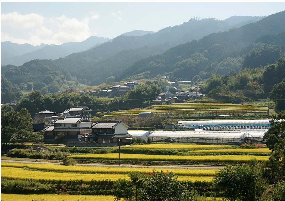
『実りの秋』（奈良県明日香村）